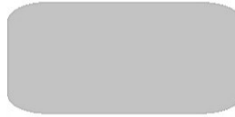
Firma / meno priezvisko zákazníka Obec Kráľ